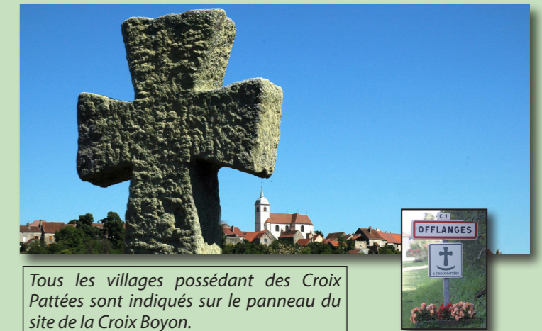
Tous les villages possédant des Croix Pattées sont indiqués sur le panneau du site de la Croix Boyon.

Die meisten der geheimnisvollen Croix Pattées de la Serre befinden sich in den Dörfern rund um das Massiv. Sie sind am Eingang der Dörfer aufgestellt und ermöglichen einen besonderen Rundgang für Personen, die sich für diese Relikte aus einer unbekannteren Vergangenheit interessieren.